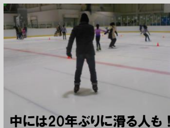
中には20年ぶりに滑る人も！