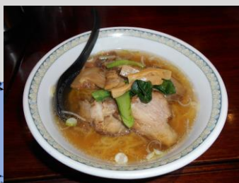
お昼は張園で中華料理